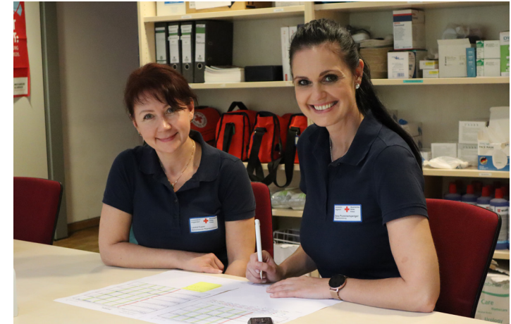
Pflegeplanerstellung ist Teamarbeit und wird in enger Abstimmung mit Familienmitgliedern und Pflegekräften durchgeführt.